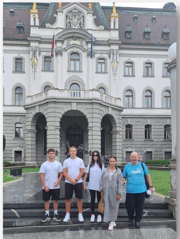
Casa Europei, Ljubljana